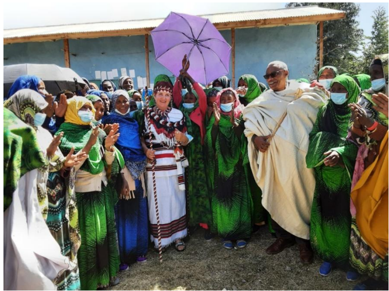
Der Generalmanager von SOSSE und ich wurden in wertvolle traditionelle Kleider gehüllt, ich wurde geschmückt und mit einem „Friedensstock“ von besonderer Bedeutung ausgestattet - ein Zeichen für ihre große Hoffnung in dieses Projekt.