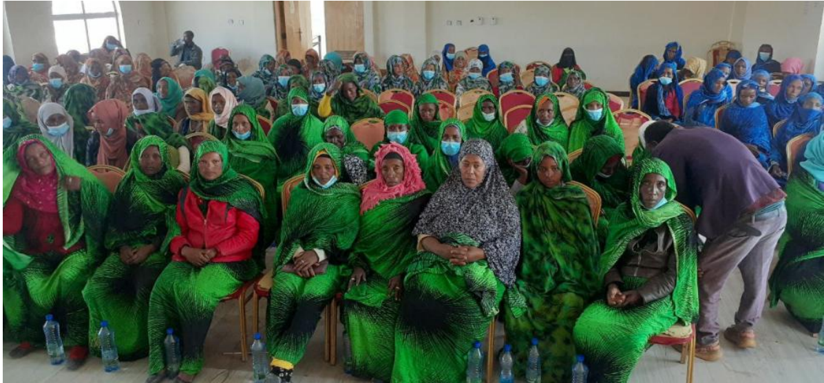
Workshops für alle Frauen in Grundlagen der Kooperative

Dann wurde in Kleingruppen mit Fachunterricht gestartet. Es wurden Schulungen in verschiedenen Interessensgebieten abgehalten wie z.B. Imkerei, Bodenpflege und Bodenbestellung, Kompost, Getreideanbau und Kleinhandel.