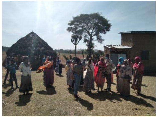
Links: Das Haus der Kooperative mit der „Garage“ für die Getreidemühle Rechts: Ein weiterer Speicher ist im Bau, diesmal ohne Unterstützung von außen und in Eigenregie.