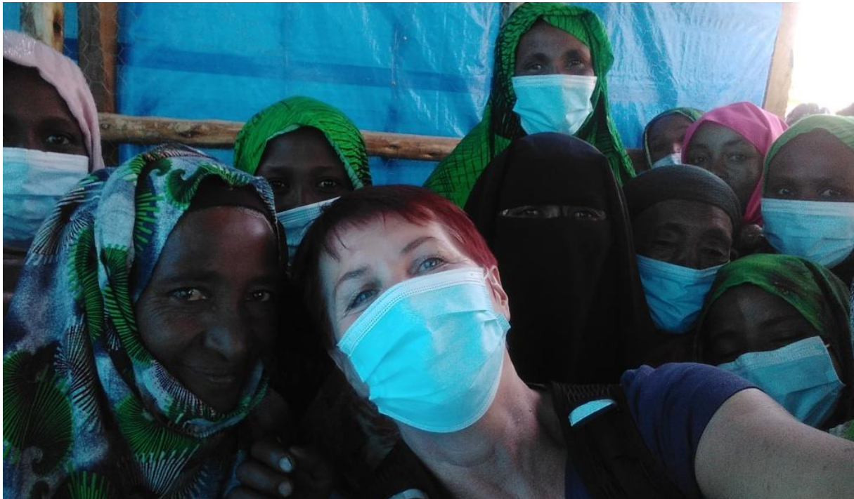
Die Euphorie und die Hoffnung auf Entwicklungsmöglichkeiten und Veränderung sind groß.