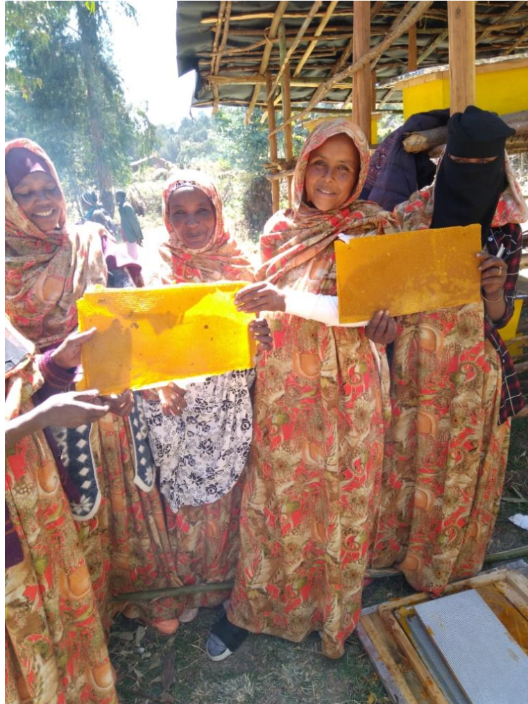
Darauf werden die Bienen ihre Waben bauen.