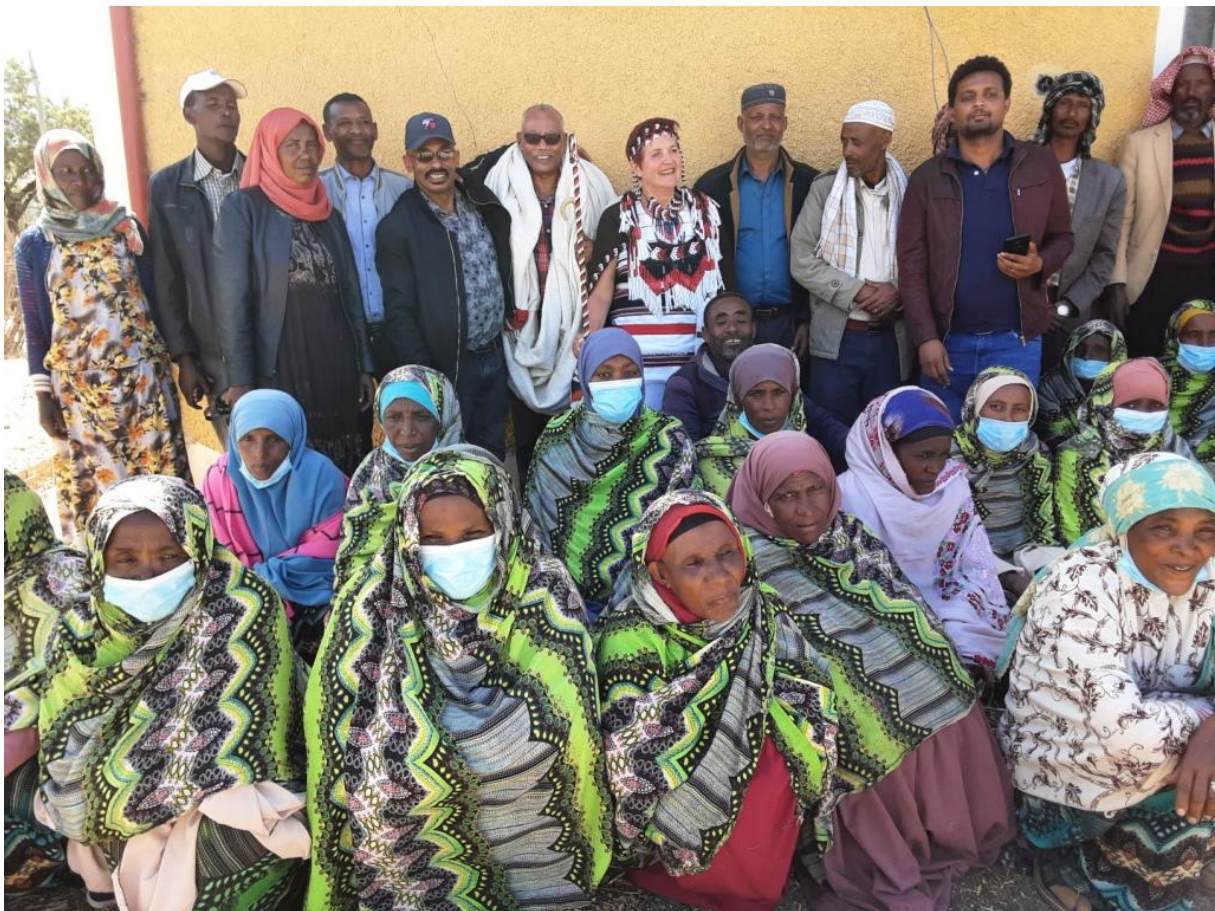
Frauen aus dem Projekt im Vordergrund – das Organisationsteam im Hintergrund

Alle waren mit eingebunden - auch die Gemeindevorsteher, Lokalpolitiker und Dorfältesten hatten Aufgaben, hielten Ansprachen oder sprachen Gebete.